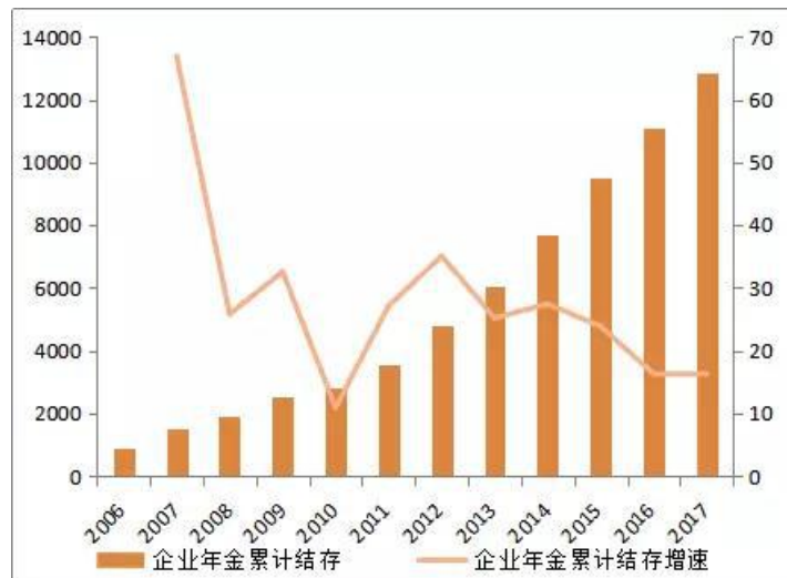
(数据来源: 人社局, 单位: 万元)

说完第一层, 现在来说说第二层, 企业提供部分。不多说, 还是想让大家看一组数据。截至2017年末, 共80429家企业建立了企业年金, 参加职工人数达到2331万人。两千多万人, 而全中国人口总数超13亿人, 所以说企业年金这部分的覆盖人数是很少很少的。而且, 大部分都集中在政府机构以及国企单位, 企业年金对普通的工薪一族来说基本形同虚设。即使在2014年开始实施企业年金和职业年金税收优惠政策, 仍无法阻挡企业年金累计结存总量增速下行的趋势。所以在可预见的将来, 企业提供的辅助性补充养老金能覆盖到普罗大众基本也是不大现实的。